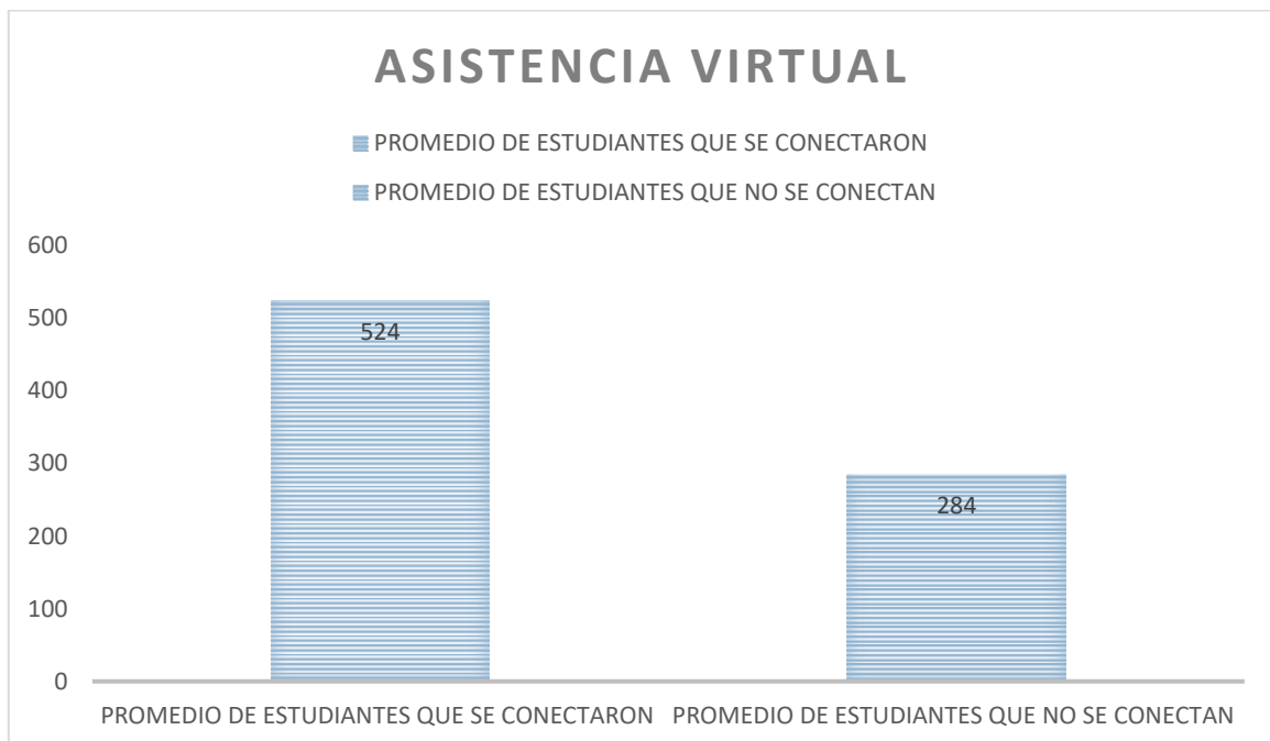
Grafico 2. Total de estudiantes asistentes en el aula promedio semanal

En el Grafico 2 , se observa la asistencia promedio del día en relación a la cantidad de estudiantes que pertenecen al calendario A que en total son 808 . Es decir que la asistencia del día 04 de febrero del 2021 fue del 67 % . Con este dato se puede observar la manera como representan a comparación del informe general 2020 el aumento significativo y representativo en términos de asistencia por salón virtual.